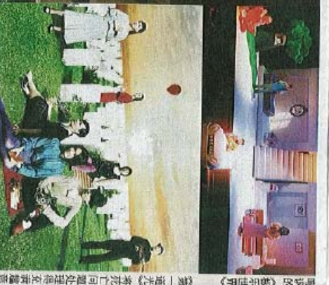
《第一道光》在同仁问题外拍得在舞臺