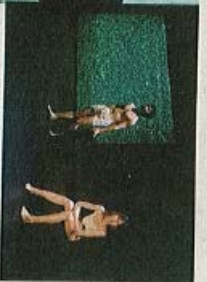
《有时我以我为记得》

陈松光的《有时我以我为记得》(Sometimes I think I remember)和安娜玛塔妮娜斯文的《透明化》(Palucchi)都是简单而现代陈松光的舞蹈作品，以影子、扁平与空间